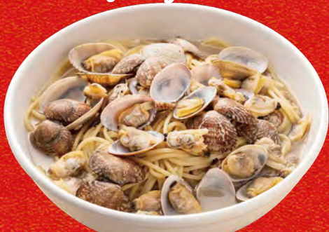
黒胡椒を効かせた あざりのスープ仕立て