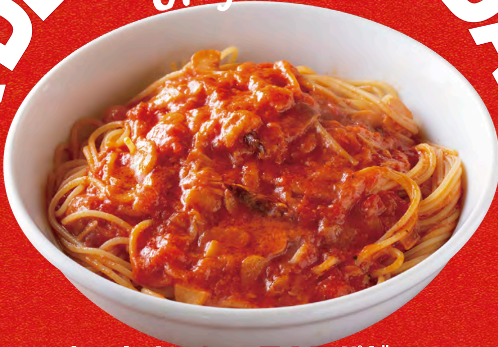
トマトとニンニクのスパゲティ